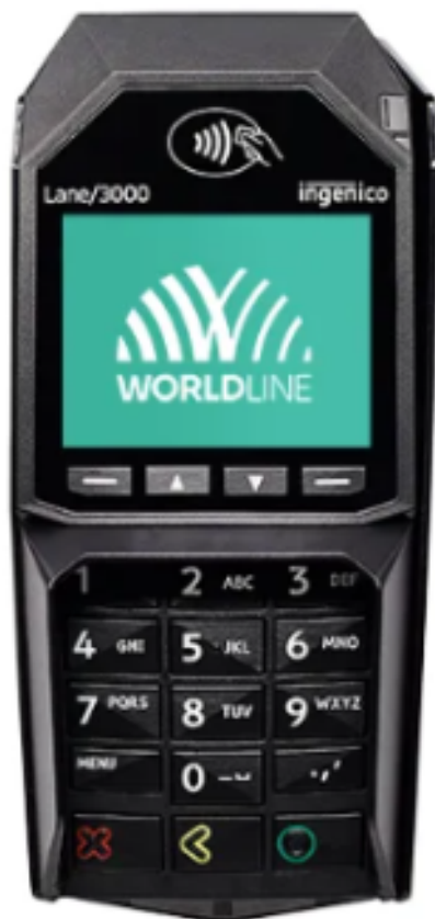
Lane 3000 - integrerad med Ethernet utan printer